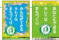
ポイ捨て防止の啓発ポスター

統一美化マーク(上記)のもと、各種媒体やメディアを通じて、散乱防止の啓発に努めています。これまで駅や社内のポスター・ステッカー、道路沿いの立看板、ポスターの掲出、バスラッピング広告など、時々々の情勢に応じた方法で、散乱防止を呼びかけています。