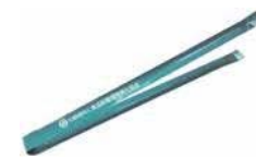
トンブ （サイズ 長さ30cm×幅2.3cm）