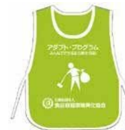
ビブス （サイド紐タイプ、フリーサイズ／着丈63cm×身丈50cm）