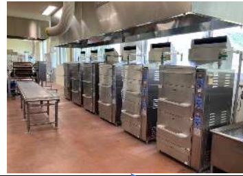
設置場所参考図 (弥生学校給食センター調理場機器配置平面図)