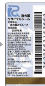
新品用シール(見本)

製品にはリサイクルシールが貼られています。耐用年数を過ぎたら、取扱い窓口へ引き渡してください。