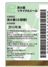
既製品用シール(見本)